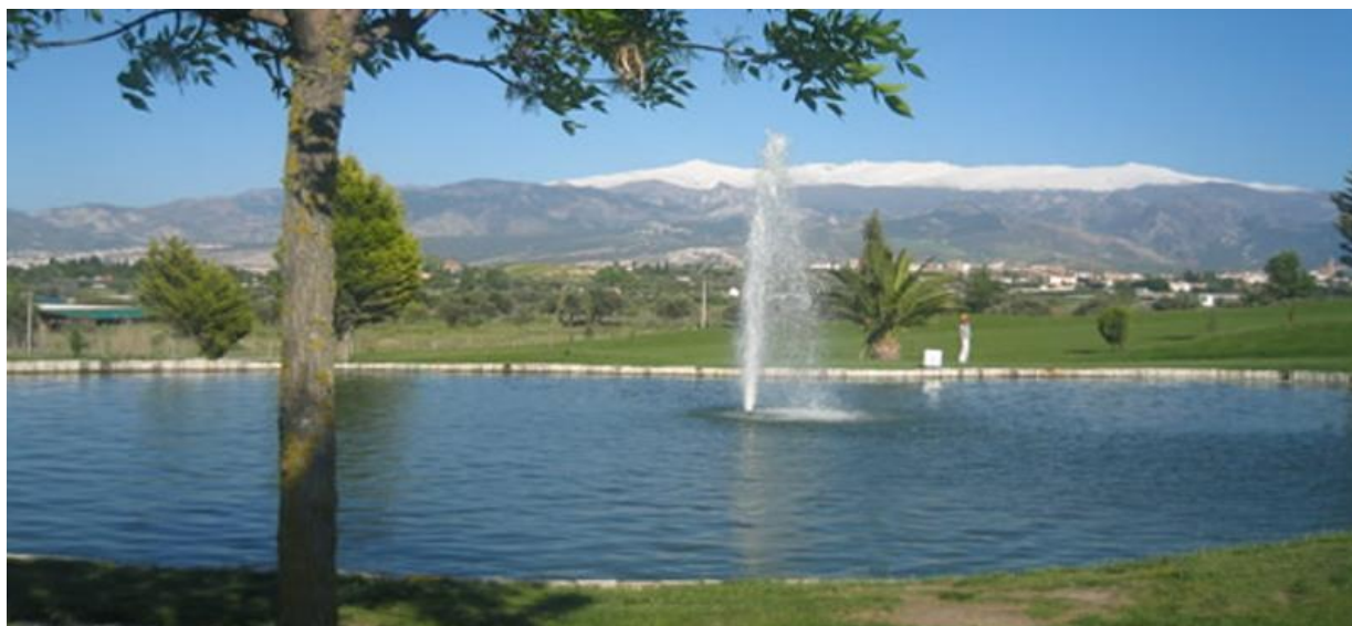
Granada Club de Golf ligger vid foten av bergskedjan Sierra Nevada