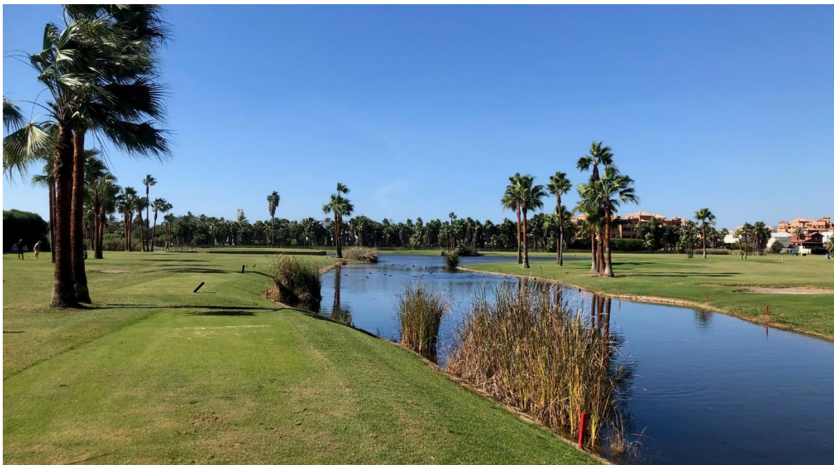
Los Moriscos Golf