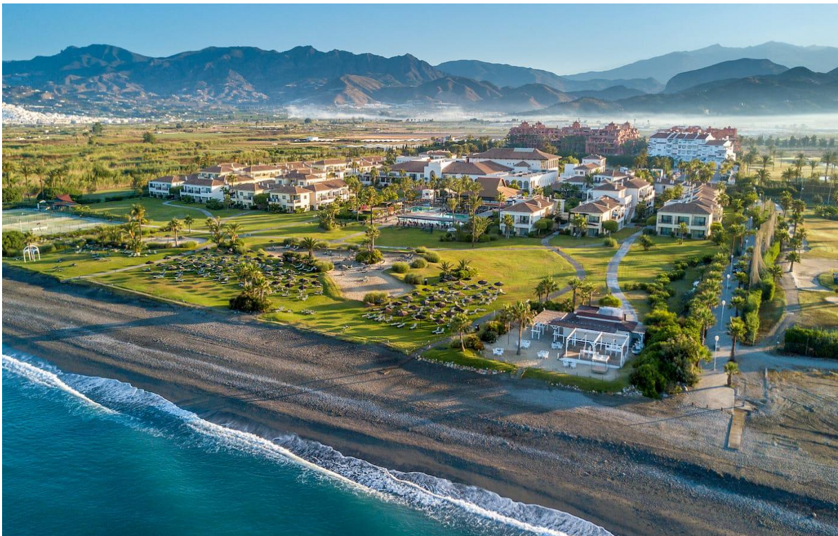
Impressive Resort Playa Granada ligger vid Los Moriscos Golfbana

Välkomna till vårt härliga golfresmål på Costa Tropical! Följ med oss till Andalusien och till den del av Spanien som har vinterns mildaste klimat. Här spelar man golf året om, och det är sommarlika temperaturer redan i april! Vi bor vid golfbanan Los Moriscos Golf på fina Impressive Resort Playa Granada . Hotellet erbjuder 4-stjärnig klass och 1:a tee på Los Moriscos Golf ligger bara ett par minuters transfer från hotellet (800 m). Vi spelar tre dagar på Los Moriscos Golf och två dagar på Granada Club de Golf (som ligger nära den historiska staden Granada vid foten av bergskedjan Sierra Nevada).