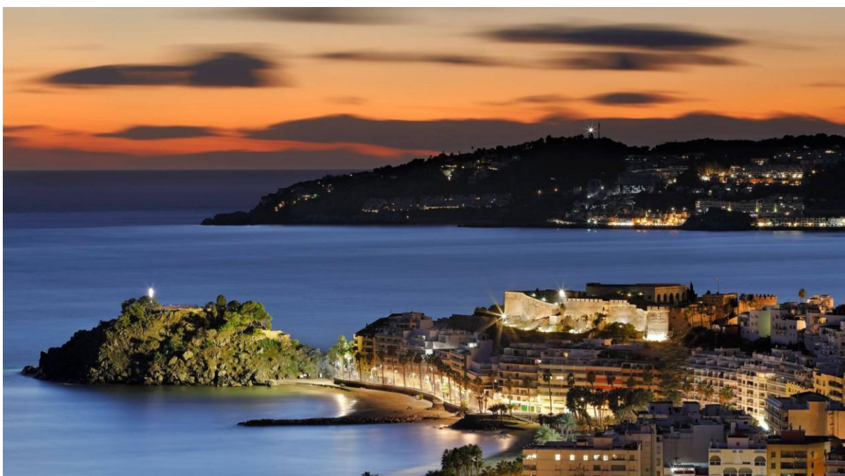
Solen går ner över Almúñecar