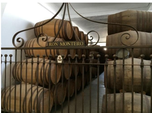
Romfabriken Ron Montero