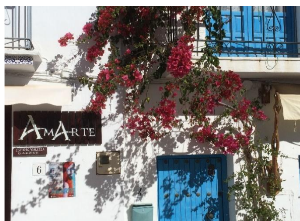
Från Frigiliana – Spaniens vackraste by

Välkommen till vårens trevligaste flygresa!