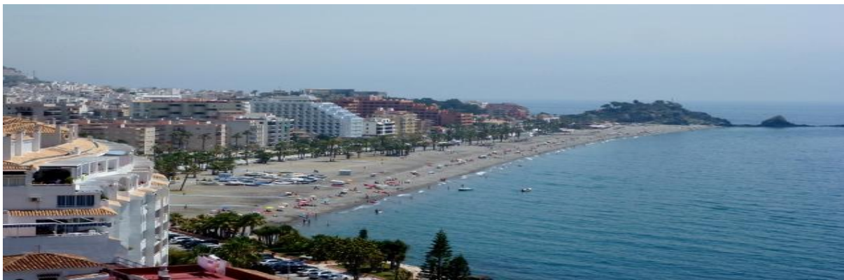
Stranden i Almúñecar

PRIS: 19 950 kr (Enkelrumstillägg: 4 950 kr)